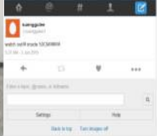
그림 5. 트위터 알림

실험환경은 그림2,3 와 같이 세로 15m 가로 2.5m의 복도 구간에서 가로 788mm 세로 545mm로 불규칙한 간격으로 설치된 장애물들로 구성되어있다. 실험 과정은 키가 다른 3명의 성인 남성을 모듈 착용 전, 후로 나누어 복도구간을 왕복하게 하였으며, 모듈의 착용여부에 따른 장애물 충돌횟수와 통과소요시간을 측정했다. 피 실험자의 모듈 착용 모습은 그림 4과 같다. 장애물이 탐지될 경우에는 그림 5와 같이 트위터의 계정으로 위험을 감지했다는 알림이 전송되게 된다. 실험의 결과는 아래의 표 1과 같다.