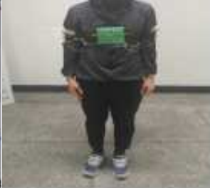
그림 4. 모듈 착용 모습