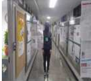
그림 3. 시뮬레이션 진 행 모습