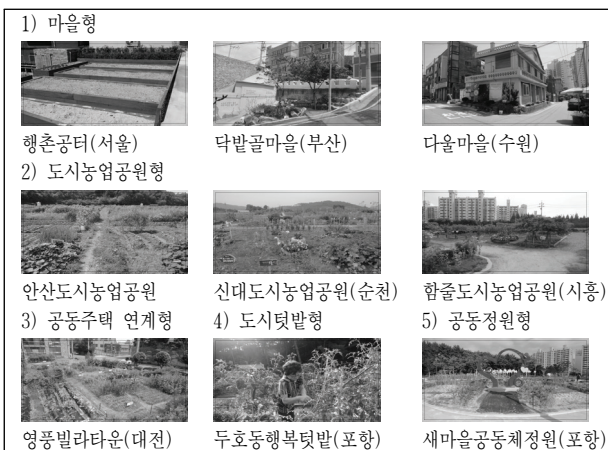
그림 1. 도시 커뮤니티가든 유형별 현장사진

국내 도시 커뮤니티가든을 유형별로 살펴보면 첫 번째 마을형은 주거환경개선지구사업과 마중물사업 등 다양한 정책사업 및 실행사업을 통하여 이루어지고 있었으며, 경작의 넓이는 다른 유형에 비하여 소규모였으나 주민자치조직과 프로그램의 수와 질은 높았다. 둘째, 도시농업공원형은 각 시도의 도시농업센터에서 주관하여 조성된 공원형 커뮤니티가든으로 분류할 수 있고, 경작할 수 있는 구좌수와 대상지의 규모는 대규모였다. 셋째 공동주택연계형은 주민자치조직의 지속성이 높았으며, 넷째 도시텃밭형은 유휴지를 활용하여 지자체에서 시민에게 텃밭을 제공하는 형태이고, 다섯째 공동정원형은 행정안전부에서 시행하고 있는 공동체정원사업으로 공원과 개인정원작품, 텃밭이 어우러진 형태를 보이고 있었다.