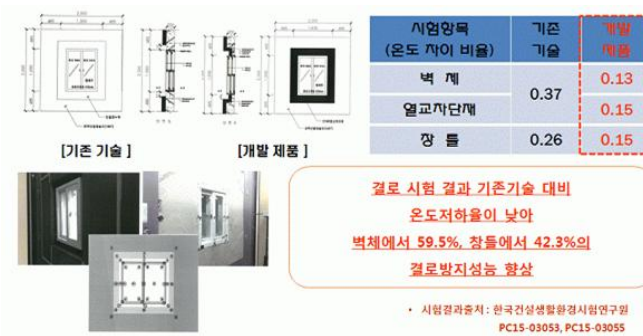
(c) 결로 대응성능 비교 실험