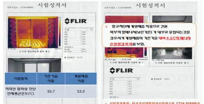
(d) 외부 표면온도 비교 측정(적외선 카메라)