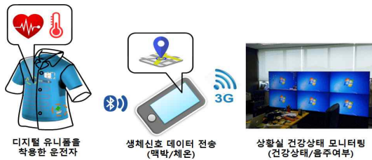
그림 1. 디지털 의류 시스템 구상도

본 논문에서는 계속해서 증가하는 교통사고의 해결책으로 그림 1과 같이 대중교통 운전자들의 건강상태를 분석하고 위험 시 스마트폰 내장 GPS를 활용하여 현재 위치를 상황실의 서버로 전송해주는 시스템의 설계를 목표로 하였다.