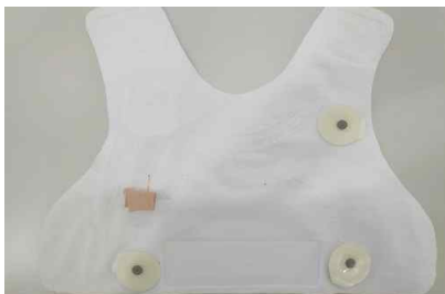
그림 2. 대중교통 운전자용 디지털 의류(내측)

디지털 의류에서 사용되는 생체신호 측정 모듈은 EFM32GG995(ARM7 CortexM3) MCU를 사용하여 저전력 기반으로 설계하였다. 그림 2와 같이 3점 전극을 이용한 Ag/AgCl ECG 전극을 이용하여 심전도를 계측하고 맥박 수를 도출하였다. 체온센서는 NTC 서미스터인 NXFT15WF104FA2B(muRata사)를 사용하여 측정하였으며 흉부 하단에 부착될 수 있도록 그림 3과 같이 부착하였다.