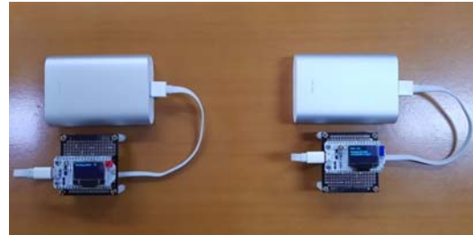
그림 1. 데이터 전송 실험환경

RSSI의 임계값을 선정하기 위해 센서 모듈을 이용한 데이터 전송 실험을 진행하였다. 통신방식의 경우 대규모 IoT(Internet of Things) 환경에서 경량의 센싱 데이터 수집을 위해 등장한 LPWA(Low Power Wide Area) 기술 중 LoRa를 선정하였다. 실험에 사용한 센서 모듈의 LoRa transceiver의 경우 Semtech사의 SX1278이 사용되었다.