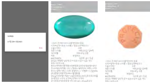
사진5(좌 : 어플리케이션 초기화면 중, 우 : 탁센,프로페시아 알약 결과 출력화면)