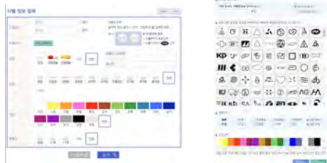
사진1(사진 검색 방법 좌: 약학정보원, 우 : 드러그인포)

현재 알약 정보를 확인할 수 있는 사이트는 약학정보원, 드러그인포, 네이버 알약사전 등이 있다. 이런 사이트들을 보면 알 수 있듯이 약 정보를 검색하는데 있어 약에 적힌 문자, 약의 색 정보, 모양, 제형, 분할선등을 직접 선택하는 방법으로 약의 정보를 알 수 있다. 이는 약의 접촉이 상대적으로 많고 더 위험한 취약계층 이 사용하기에는 불편하고 어려운 점이 많다.