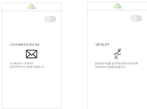
(a) 위치 정보 전송 (b) 움직임 감지

본 논문에서는 조난 방지 애플리케이션 기능 구현을 위해 Java 언어와 Firebase DB를 활용하였다. 이 애플리케이션의 메인화면에는 ‘보호자에게 위치 정보 전송’, ‘움직임 감지’, ‘태그 인식’ 버튼이 나열되어 있다. 메인화면에서 그림 2의 (a) 위치 정보 전송, (b) 움직임 감지, 그림 3의 (a) NFC 태그 인식으로 이동할 수 있다. 또한 메인화면에서 ‘현재 위치에서 바로 구조 요청’ 버튼을 클릭하면 119에 구조를 요청한다. 구조 요청 내용에는 GPS 센서를 이용한 현재 위치와 Firebase에 저장된 사용자 정보들이 포함되어 있다.