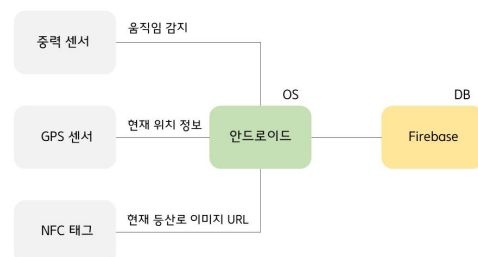
Fig. 1. 조난 방지 애플리케이션 시스템 구성도

본 논문에서는 스마트폰의 중력 센서와 GPS 센서, NFC 태그를 활용하여 움직임 감지 기능, 위치 정보 전송 기능, NFC 태그 인식 기능을 설계하고 구현한다. 움직임 감지 기능은 중력 센서의 값에서 이상이 감지되면 GPS 센서를 통해 구한 현재 위치와 사용자의 정보를 문자 메시지로 119에 전송할 수 있도록 설계한다. 위치 정보 전송 기능은 GPS 센서를 활용하여 30분마다 보호자 전화번호로 사용자의 현재 위치를 전송할 수 있도록 설계한다. 또한, 등산 중 길을 잃었을 경우, 사전에 설치된 NFC에 태그하면 현재 위치와 등산로 정보를 출력하도록 설계한다. 조난 방지 애플리케이션 시스템 구성도는 그림 1과 같다.