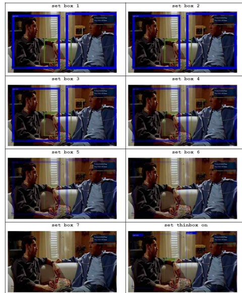
Fig. 3 Algorithm execution example screen