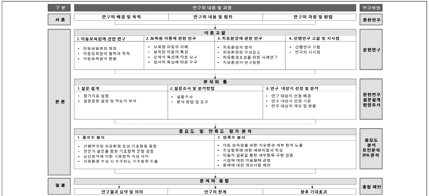
Figure 1. 연구 방법 흐름도