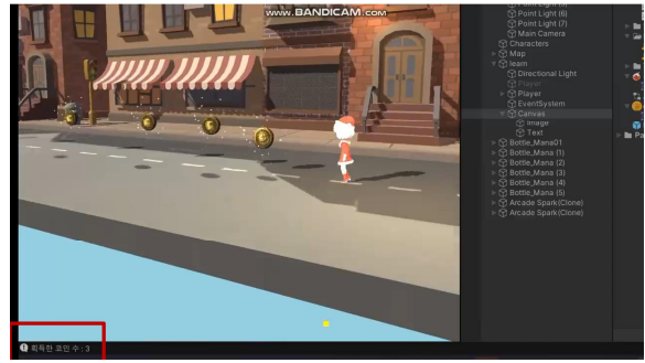
Fig. 4. 점수 화면

본 논문에서는 키넥트 센서를 이용하여 사용자의 동작을 센싱하고 게임의 캐릭터에 연동하는 게임을 설계하고 구현한다. 키넥트 센서에서는 사용자의 스켈레톤과 조인트 정보를 센싱한다. 측정된 스켈레톤 정보를 이용하여 특정 관절 좌표를 기준으로 동작을 판단한다. 오른손의 관절 좌표가 왼쪽 어깨 관절 좌표보다 위에 있을 때 오른손을 올린 동작으로 인식하여 플레이어가 점프한다. 플레이 중에는 전진하며, 코인을 획득하면 화면에 획득한 코인이 점수로 변환되어 출력한다.