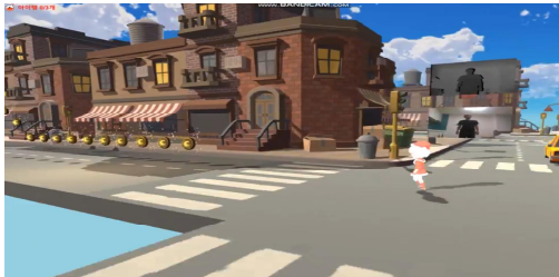
Fig. 2. 게임 시작 화면

본 논문에서는 게임 애플리케이션 기능을 구현하기 위해 키넥트와 유니티를 사용한다. 본 논문에서 구현한 애플리케이션은 그림 1과 같다.