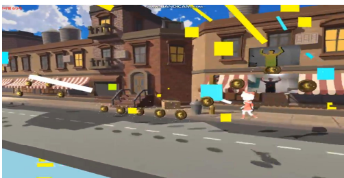
Fig. 3. 손을 올렸을 때 점프하는 장면

그림 2 화면에서는 키넥트 센서를 활용하여 사용자의 동작을 감지한다. 사용자의 왼손이 특정 좌표값 이상으로 올라가면 게임이 시작된다. 게임이 시작되면 여러 장애물이 나타나고, 오른손이 왼쪽 어깨보다 높게 올라가면 그림 3과 같이 캐릭터가 점프하는 기능을 구현한다. 이 기능을 이용해서 장애물을 피한다.