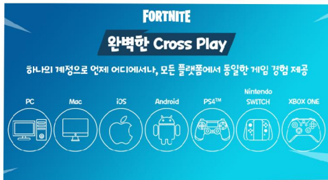
Fig. 3. Cross-platform from Fornkite

크로스 플랫폼이란 게임이나 애플리케이션이 여러 가지 다른 플랫폼이나 디바이스에서 사용될 수 있는 기능을 의미함. 예를 들어 PlayStation 5 콘솔용으로 개발된 게임을 개인용 컴퓨터나 모바일 장치에서 플레이할 수 있도록 하여 플레이어가 원하는 플랫폼에서 게임에 액세스할 수 있도록 할 수 있음. 점점 더 많은 사용자들이 다양한 장치를 사용하여 게임을 플레이함에 따라 플랫폼 간 호환성이 비디오 게임 산업에서 점점 더 중요해지고 있는 시점이라고 볼 수 있음. 플레이어가 여러 플랫폼에서 자신의 게임 캐릭터에 액세스할 수 있도록 함으로써 개발사는 더 많은 사용자에게 도달하고 게임의 잠재적 고객의 기반을 늘릴 수 있다. 하나의 계정으로 언제 어디서나, 모든 기기에서 동일한 게임 경험을 제공한다는 것은 사용자에게 호환성을 제공하는 매우 중요한 기능이자 앞으로 게임 개발에 중요한 요소가 될 것이다. 이러한 크로스 플랫폼이 제공될 수 있는 이유에 대해 간단히 설명하자면 클라우드:5G와 같은 기술들의 발전을 꼽을 수 있다. 과거에는 고 사양 게임을 하기 위해 게임 전용 PC를 맞추거나 최신식 콘솔 디바이스를 구매하거나 고성능 PC가 있는 장소(PC방, 게임방)에 가서 게임을 해야 했다. 하지만 클라우드 게임 분야의 발전으로 특정 게임을 위한 최적의 게임 전용 디바이스가 무의미해지고, 이로 인해 다양한 게임에 대한 진입장벽이 낮아지게 되었음. 이러한 변화로 인해 pc, 모바일, 콘솔 게임 분야와 장르의 경계가 흐려지면서 게임 개발에 제한이 없어졌다고 볼 수 있다.