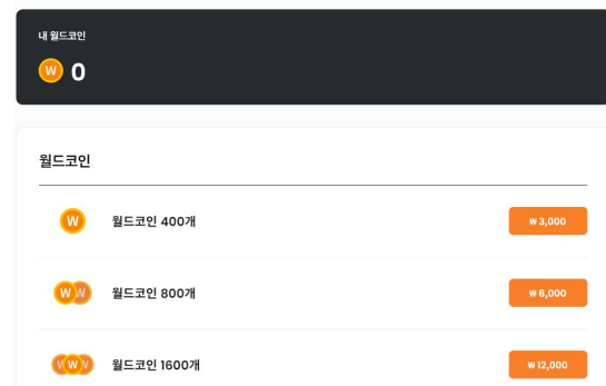
Fig. 2. "World Coin purchase section on the MapleStoryWorld website"

제페토는 사용자가 월드, 아이템, 콘텐츠등을 자유롭게 만들 수 있는 기능을 무료로 제공한 후 수익 창출을 할 수 있게 하고 있다. (수수료30%는 네이버에 지불하는 구조) 반면에 메이플스토리 월드는 월드코인을 구매하기 위해서는 홈페이지를 통해 구입을 해야만 하며, 사용자가 만든 콘텐츠나 아이템에 대해서는 아직 판매 권한이 없는 상황이다.