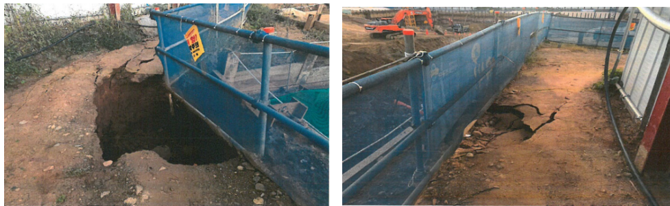
Fig. 3. 아파트 터파기 공사 현장 상수관 파열로 토사 유실 및 지반 함몰