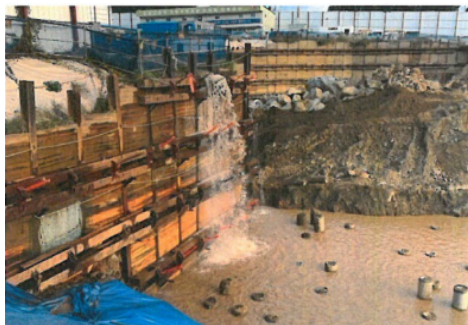
Fig. 4. 상수관 파열로 상수 유입