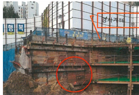
Fig. 5. 흠막이 가시설의 토류판 파손