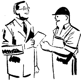
전문가에 의한 공장지도