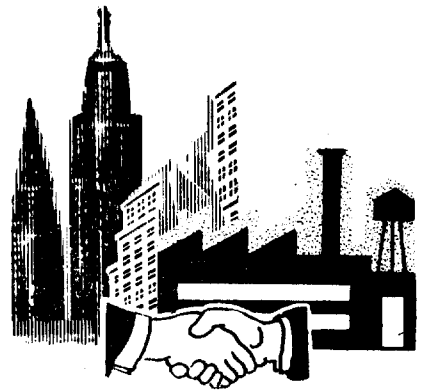
국내외 산업체 시찰 국내외 연구기관과의 제휴