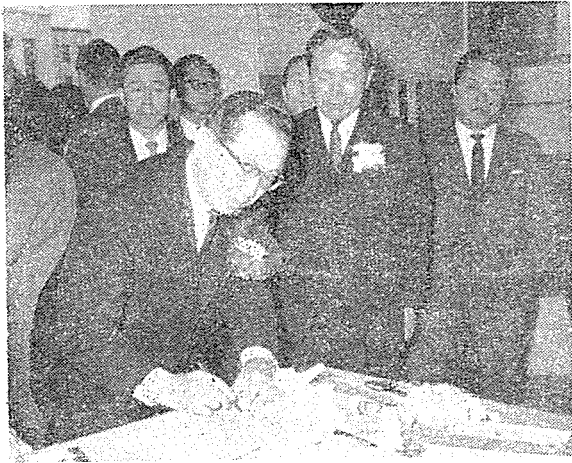
〈芳名錄에 싸인하는 丁總理〉

展示場 全面上에는 左右兩側에 太極旗가 높이 솟고 本協會 會旗를 비롯한 形形色色의 찬란한 各 出品會社의 社旗가 훈훈한 바람에 나부끼고 있으며 政府 各處와 各界에서 보내준 수 많은 花환의 그윽한 향기는 더욱 展示會 開場을 빛나게 해주었다.