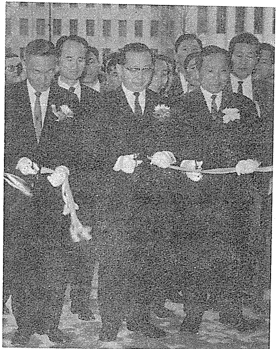
〈開場式 테이프 끊는 丁總理〉

☆ 同展示會는 32個社의 優秀建設資材 600餘點이 出品 되었는데 都市民의 住宅難 解決과 우리나라 建築界의 時代的 要望에 따라 韓國 建築 界史上 最初의 壯舉로 一般國民은 勿論 建築 界에서 높이 評價되었다.