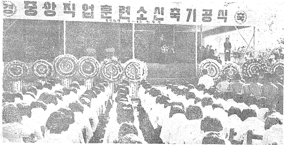
< 東洋最大의 職業訓練所가 仁川市에 세워졌다 >