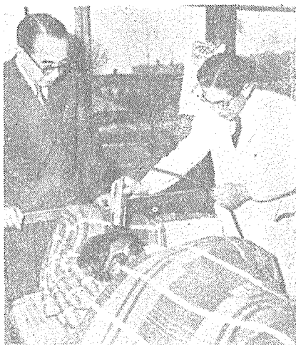
<죽음의계(방사능나진)로 인하여 原子病에 걸린 患者에 가이거 計數管으로 방사능을 조사하고 있다>