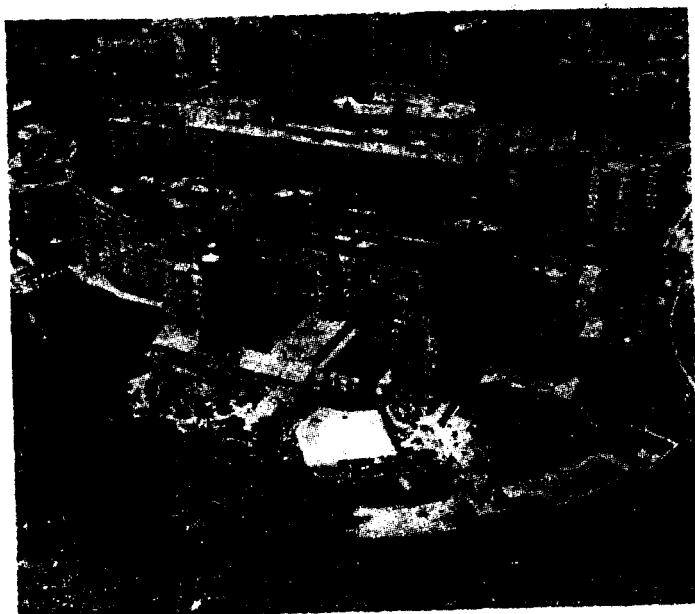
總會場所인 Sheraton-Park Hotel