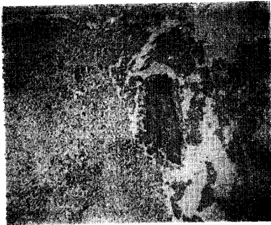
Fig. 4. Pulm. actinomycosis 小膿瘍 H. E. 10×10.

以上の 所見으로 우리나라에서는 稀有한 Pulmonary Actinomycosis 라고 診斷되었지만 이것이 Primary인지 Secondary 인지를 現時點에서 判定하기는 困難하다. 그러나 患者의 病歷이 14年이라는 長期間에 症狀이 계속 되었다는 點을 考慮할때 어떤 非特異性炎症이 肺上葉에 發生하고 이것이 潰瘍性, 破壞性病變을 反復하여 氣管支擴張을 이르게 二次的으로 Saprophytic infection 으로서 放線菌이 寄生한 것이 아닌가 思料된다.