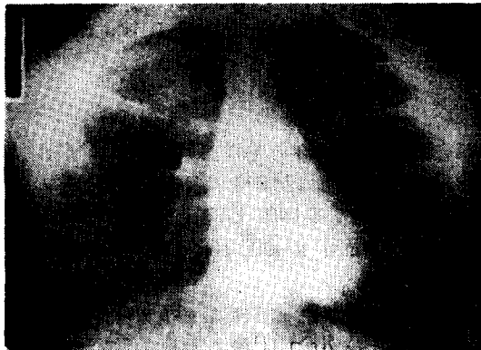
Fig. 2. Apical view 右上葉에 局限한 Pulm. actinomycosis