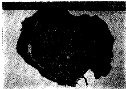
Fig. 3. Pulm. actinomycosis의 切除標本(右上葉)

氣管支粘膜은 潰瘍性으로 一部擴張되어 있고 末梢氣管支속에도 菌塊樣膿이 充滿되어 있었다.