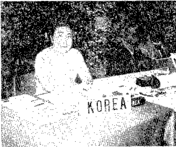
〈한국의 正代表로 참석했던 用山草會長〉