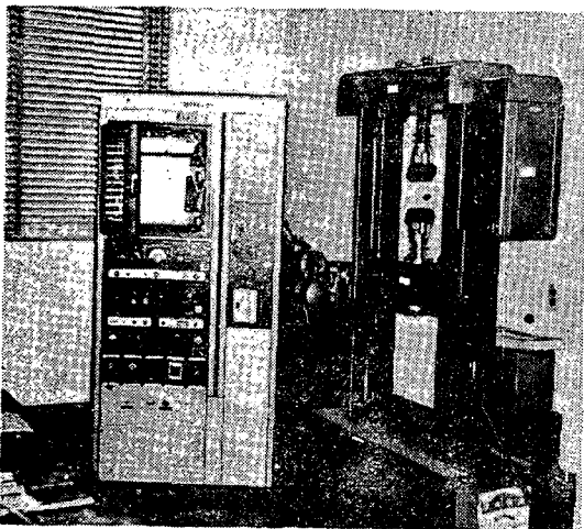
Fig. 2. Instron testing machine.