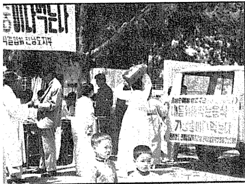
◁사진 /보건의 달을 맞아 기형에서 실시하고 있는 가두 무료검변광경