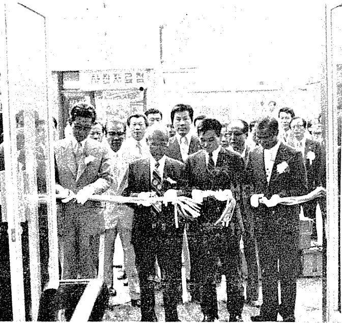
同會館 開館의 儀을 祝하는 光景