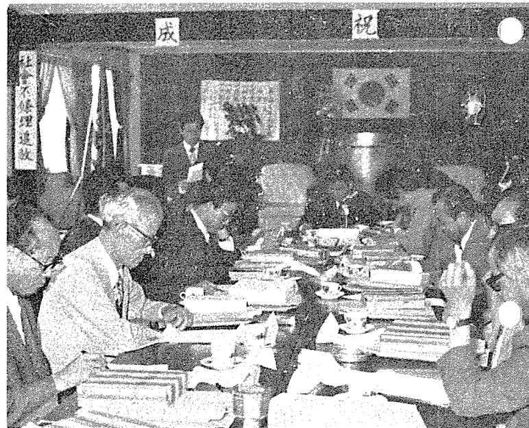
이날 同 會館 會議室에서 全國 市道支部長 會議가 開催되었다.

本部任員 및 全國支部長들이 參席한 이날 會議에서는 75年度 第1回 追更予算案을 審議하고 이어 当面課題에 對한 隔意없는 意見交換과 對策이 協議되었는데 特히 이날 會議에서는 庶政刷新業務를 보다더 強力히 그리고 效果的으로 推進하는 方案과 防衛誠金 1千萬원 募金 目標達成을 爲해 힘쓸것을 거듭 다짐 했다.