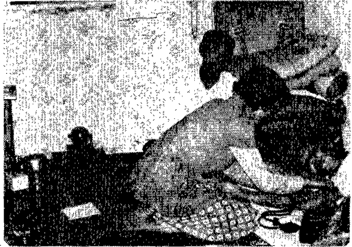
〈가정방문하여 질환을 측정해 주고 있다〉

연회지역사회의 특수성을 감안하여 연회지구 아파트자치회, 서울특별시 및 연세의료원이 합심하여 영세주민을 대상으로 시범적인 보건관리와 의료봉사를 함과 아울러 의료원내 각 대학 교직원과 학생들의 지역사회 보건의 교육과 연구를 하려는 것이다. 최종목표는 지역사회 복지와 개발에 있다.