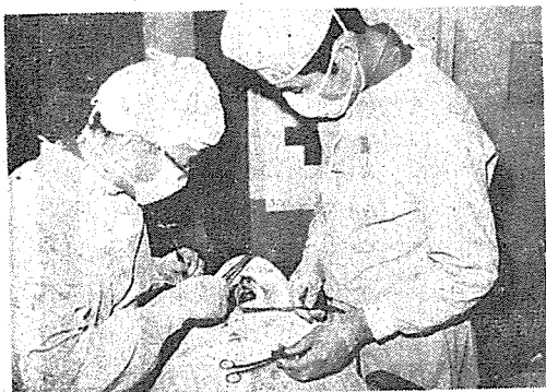
<토순환자 무료 수술광경>