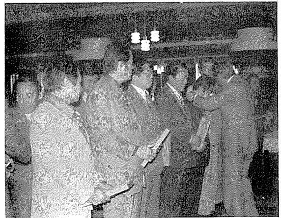
協會育成發展에 功이 큰 여러 會員에게 感謝牌 授與光景