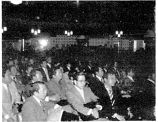
總會場에서의 各 地區 代議員의 眞摯한 모습