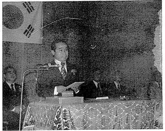
祝辭하는 전석홍 光州市長