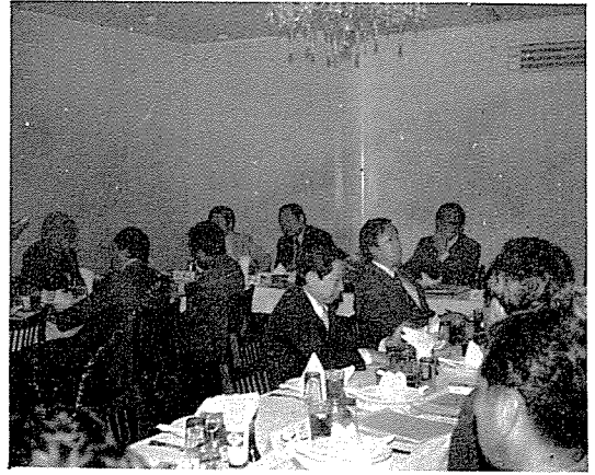
總會에 앞서 열린 4月 15日 下午 各市道支部長 會議