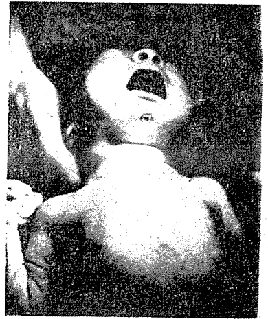
寫真 5. 手術後狀態