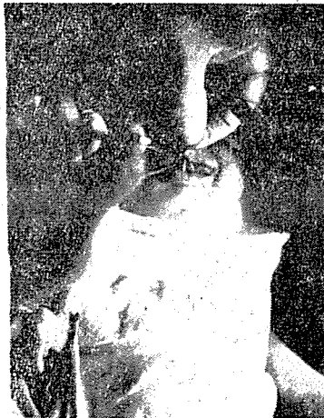
寫真 4. 手術中