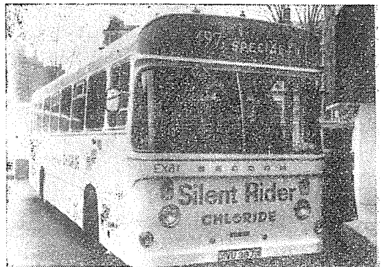
영국 케이블콤퍼사가 개발한 再發電裝置가 된 드리스터 컨트롤러를 갖춘 사일런트 라이더전기버스. 이 버스는 현재 북부영국 만체스터시에서 운행되고 있다.

케이블콤퍼사의 드리스터컨트롤러는 현재 再發電裝置가 없는 舊型의 것이 전세계에 보급되어 있거니와 재발전장치가 된 최신형을 갖춘 전기 자동차들도 이미 상당수 나와 있다.