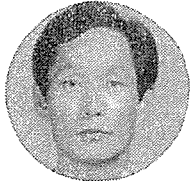
○장원표 학보수안 柳根昌團 員은 호 파진인용 농교유물 위하역지