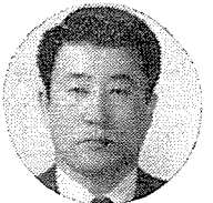
○새마을 기술봉사 단원인 500여 사단 1, 단원인도 단결성과 기술지도