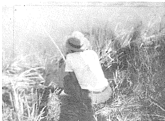
4290年 10月 13日 橋門里에서 낚시大會 記念