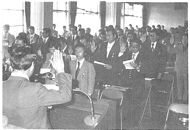
都市새마을운동 및 서정쇄신 촉진대회석에서 신서하는 회원들

會員都市 새마을운동 및 서정쇄신 촉진대회 개최. 지난 3월29일 오후 1시 건설회관 강당에서 400여 회원이 참석한 가운데 새마을운동 및 서정쇄신 촉진대회를 갖었다.