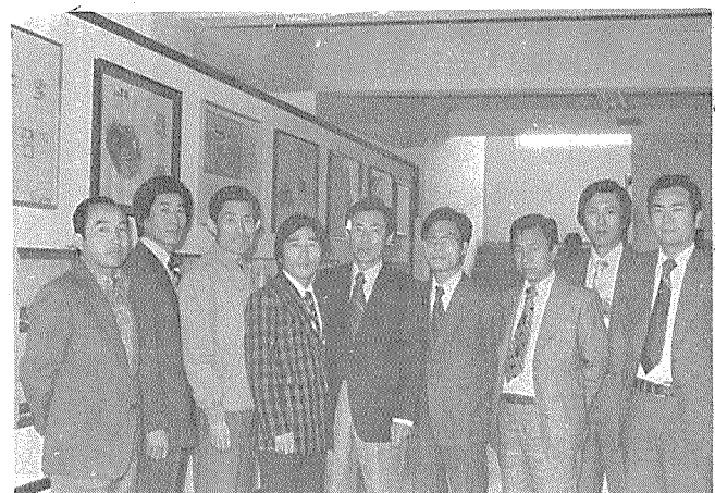
침묵회 건축사들의 건축전 모습