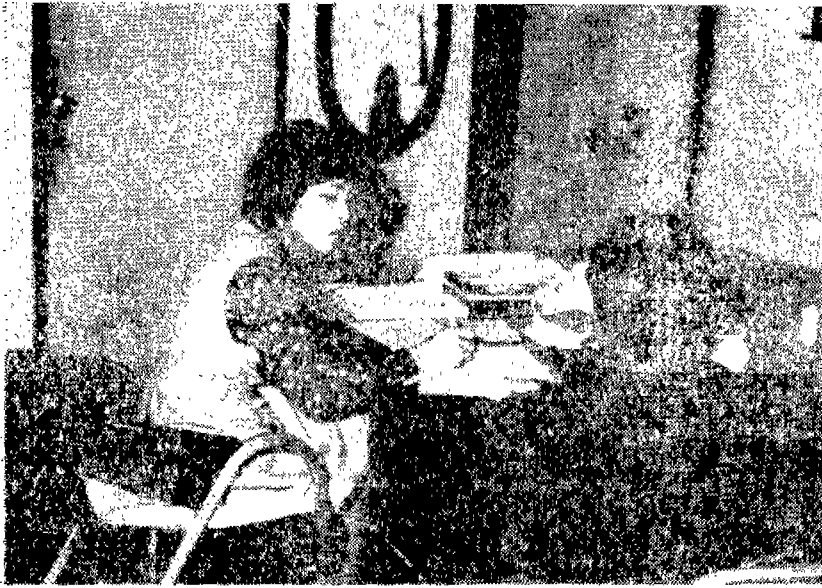
〈아동과 상담하고 있는 장면〉

결식하는 행위” “14세 미만의 아동에게 흥행의 목적으로 곡예를 시키는 행위” “14세 미만의 아동을 주점 기타接客업소에 종사시키는 행위” “자기의 보호 또는 감독을 받는 아동을 학대하는 행위” 또 “흥행장이나 유흥접객업소에 미성년자를 출입시키거나 이들을 상대로 증기문란 행위를 위한 영업을 하는 등 미성년자보호법 제3,4조에 어긋나는 행위. 이외에도 미성년자와 관계되는 근로기준법, 직업안정법, 윤락행위방지법 등에 저촉되는 행위들로서 누구나가 자전신고할 수 있다.