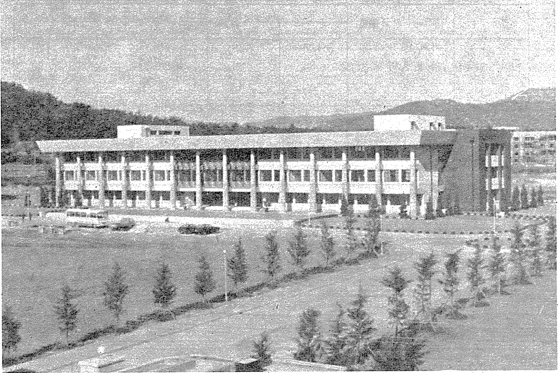
〈사진 : 昌原技能大學 本館 全景〉

에는 재학생에 대한 징병검사연기제도가 없기때문에 재학기간중 징집으로 인한 교육손실을 최대한으로 줄이기 위하여 병역의무를 마쳤거나 면제된 자에 한하여 입학지원케 하였다. 그러나 야간반의 경우 산업체 병역특례자에 대해서는 주간 근무를 종료하고 야간에 재학할 수 있으므로 입학지원할 수 있게 하였다.