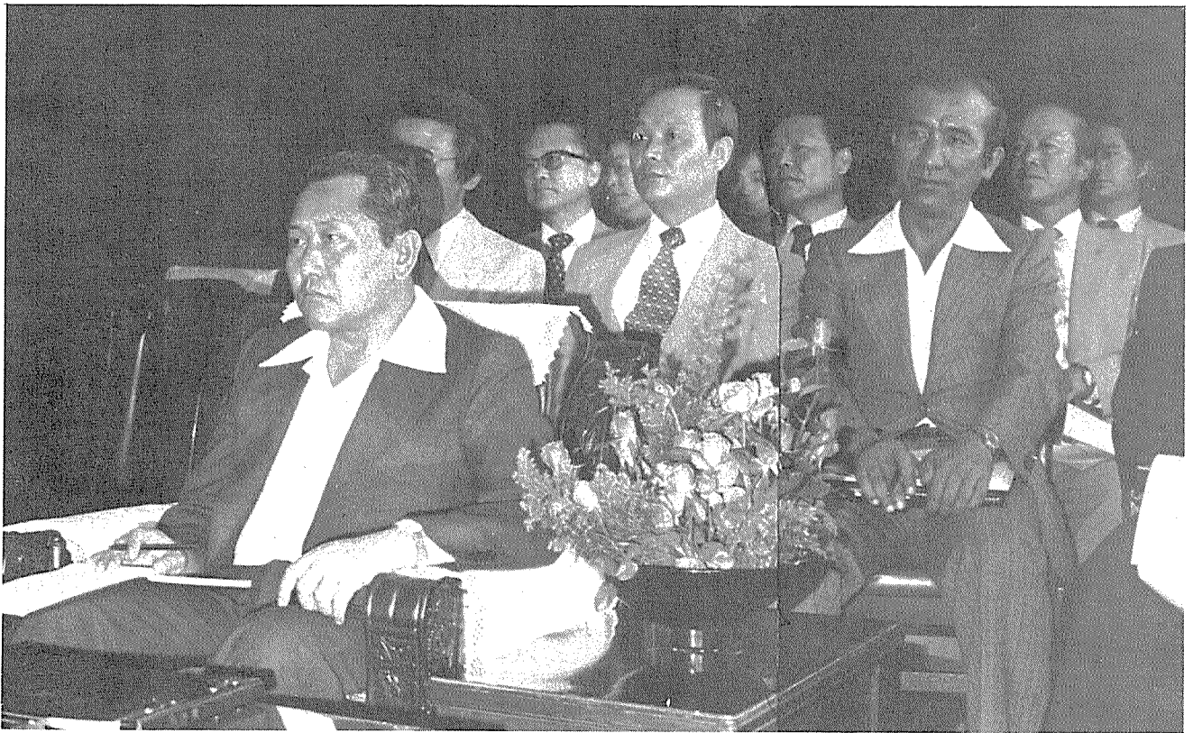
사진설명 : 現況을 듣고 있는 建設부장관