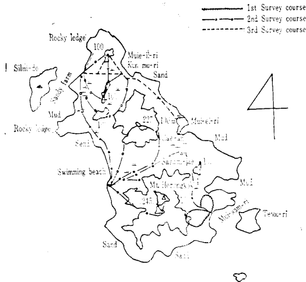
Fig. 2. Courses of the survey by the authors in island Muie

해안에는 곰솔이 植栽되어 있지만 해안에서 떨어진 곳에는 전혀 없고 노간주나무, 참나무, 청미래덩굴 등이 가끔 보였다.