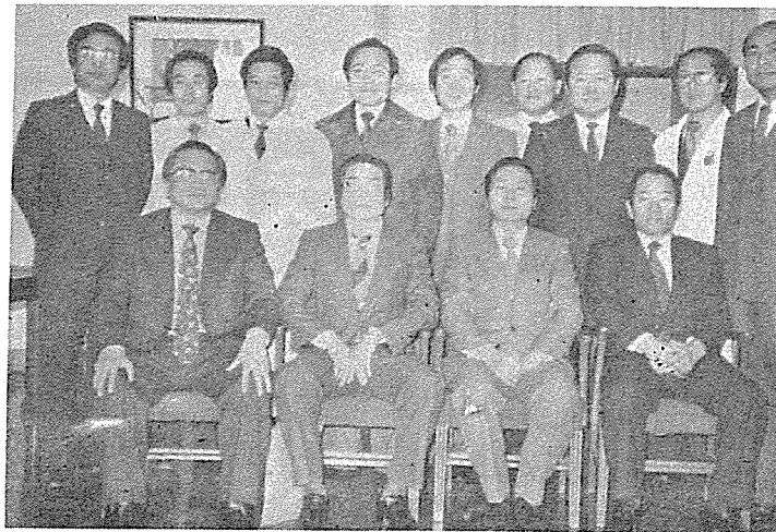
회의를 마치고 각 분과학회장의 기념촬영.