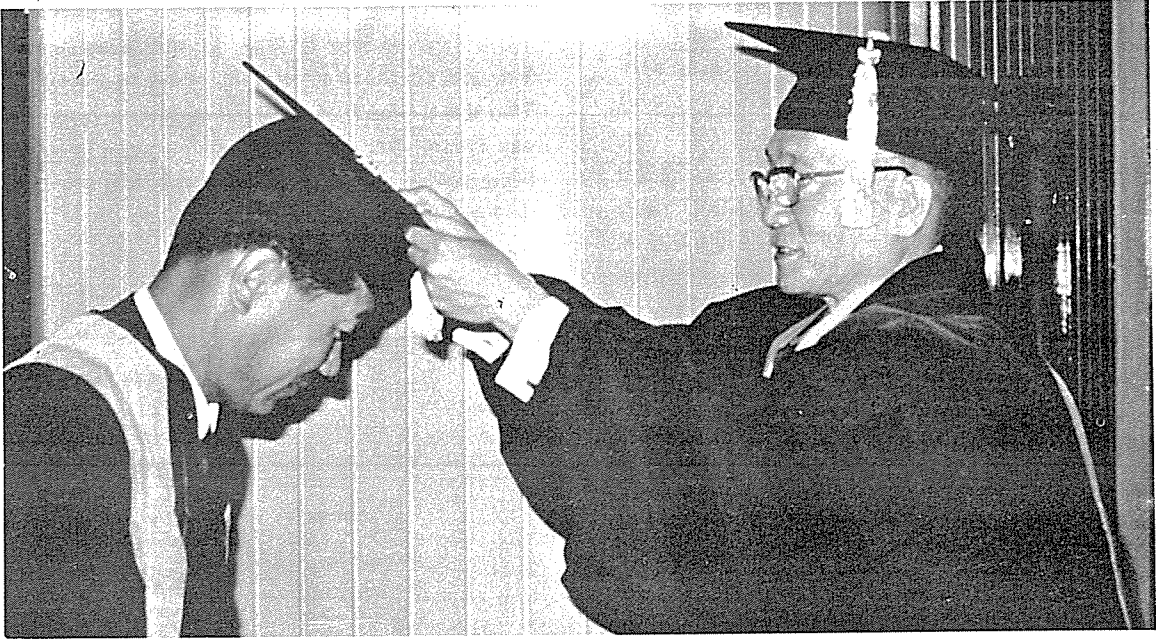
① 1968년 FICD 회원인준을 받는 모습