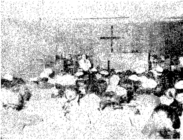
전체 간호원 실무교육 장면

Cardiac arrest, Cardiac arrhythmia, Cardio-Pulmonary resuscitation, How to use of the crush cart, Emergency drugs, E.K.G., Acute respi