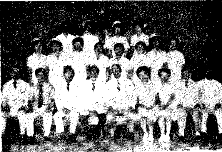
중환자 간호교육(CCDP Course)을 마치고 수고하신 강사와 수료생이 한 자리에 모여.....