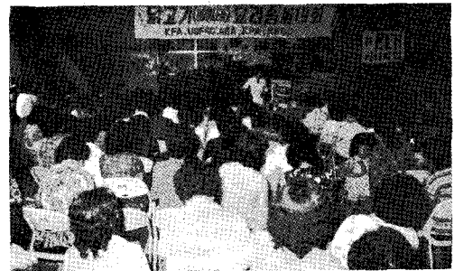
△ 본회는 소비촉진책의 일환으로 닭요리 강습회를 개최한다 (사진은 본회가 실시한 작년도 닭요리 강습회)

한편 2차요리강습회는 금년말까지 서울지역을 비롯한 기타 지역에서 추진될 예정이다.