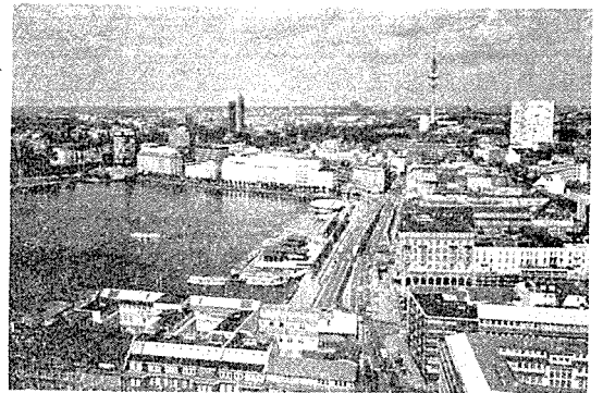
북부독일의 중심 함부르크 市街

외과적인 이식술과 순서도 매우 중요하며 7년 이상 관찰된 40여 예를 평가하면 recipient crypt는 이식될 치아에 앞서 준비되고 dummy tooth를 넣어 두었다가 이식치아는 곧 바로 아무런 조작없이 매입되는 것이 가장 좋다는 것이다. 아무리 생리식염수나 무균적인 가재에 놓아 두어도 일단 외부에 오래 있으면 있을수록 치아를 많이 만지면 만질수록 예후가 좋지 않았다고 한다. 어떤 형태로든 이식시기에 근관치료등을 행하는 것은 치근면의 치근막 세포를 건조시킬 뿐이며 이식치아를 elevator 등으로 들어낸 경우는 거의 대부분에서 치근의 흡수를 보였다고 하므로 단지 치관부만 잡도록 권하였다.