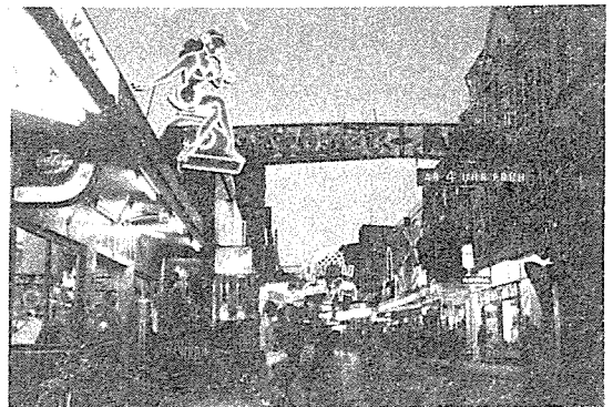
함부르크의 유흥가인 쌍 파울리의 밤

대개 periapical repair와 calcific closure의 좋은 예후를 보이지만 드물게는 근단부의 염증이 apical barrier 형성후에도 남아 있는 수가 있다. 이때는 apical surgery로 근단병소를 제거할 수 밖에 없다.