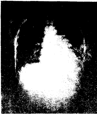
Fig. 4. Chest PA in case 2.

이학적 및 검사소견 : 입원당시 체중은 28kg으로 중등도였고, 혈압은 120/90, 맥박 110/min, 체온 37.5℃, 호흡 40/min이었다. 흉부 청진상 좌측 전방 폐야의 호흡음은 감소되었고, 습성잡음이 들리는 것 이외에 특기할만한 소견은 없었다. 혈액 검사에서는 백혈구 15,800/mm 3 , 백혈구 분획상 분엽성 호중구 58%, 단순 호중구 6%, 임파구 34%, 단핵구 2%였으며 혈색소 12.4gr/dl, 적혈구 양 37.5%, 적혈구 침강속도는 52mm/hr였다. 뇨와 간기능 검사 결과는 정상범우 내에 있었고, 심전도상 이상은 없었다. 입원당시 흉부 단순 촬영상 좌측 폐문부에 종괴의 음영을 보였고, 종격동과 기관지 음영은 정상 위치에 있었다(Fig.4).