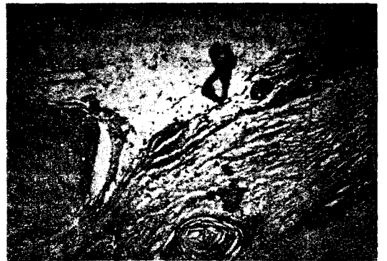
Fig. 3. Pathologic finding in case 1.

수술후 경과 : 합병증 없이 수술후 9일째 환자는 퇴원하였으며, 퇴원시 흉부단순 촬영상 이상소견은 발견할 수 없었다.