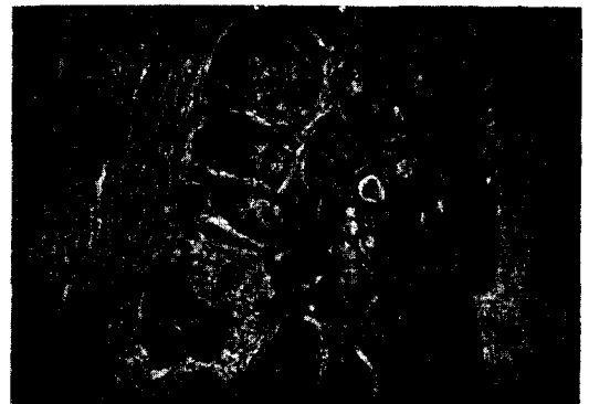
Fig. 7. Pathologic finding in case 2.