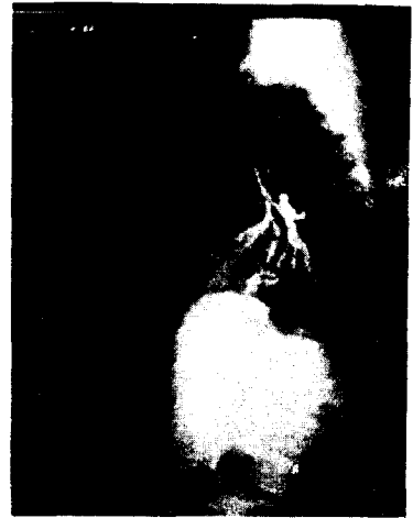
Fig. 5. Bronchogram: Lateral view.

조직병리 소견 : 종양은 육안적으로 타원형이고, 크기는 9.5×7.0×4.0cm이었으며, 외면은 비교적 평탄하고 은빛을 띠었다. 절단면은 크기가 다른 여러개의 공동이 있고, 공동안에는 열은 회백색이며 반유동성인 피지가