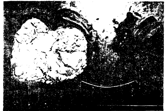
Fig. 6. Gross sectional finding in case 2.

저류되어 있었고 피지내에는 모발도 여러개 포함되어 있었다(Fig.6). 광학현미경상 피부와 피부 부속기관, 연골 및 지방세포, 상피세포 등을 관찰할 수 있었고, 악성변화는 없었다(Fig.7).