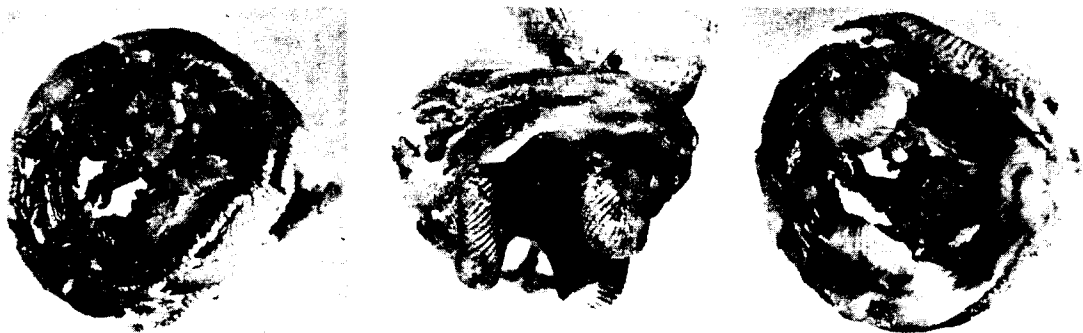
Fig. 2 파괴된 인공판막