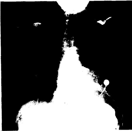
Fig.3 수술후 단순 X-선 사진

있음에도 불구하고 치명적인 합병증이 될 수 있으며, 이것은 크게 술후 60일 이내에 발생하는 조기 심내막염과 60일 이후에 발생하는 후기 심내막염으로 나눌 수 있다. 현재 사용되고 있는 여러 인공판막에 대하여 많은 사람들이 약간의 다른 결과를 보고하고 있으므로 흔히 쓰고있는 판막 몇가지에 대한 술후 합병증의 정도를 나열해보면 다음과 같다.