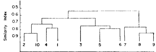
Fig. 2. Hierarchical dendrogram of phytoplankton communities.

점은 하나의 群集으로 묶인다. 또한 제 7 지점과 제 8, 9 지점의 IS 값이 각각 73.25, 70.31로서 한 群集을 形成한다. 따라서 衣岩湖의 植物性 plankton 群集은 3가지 群集型, 즉, Oscillatoria community(제 1, 2, 4, 10 지