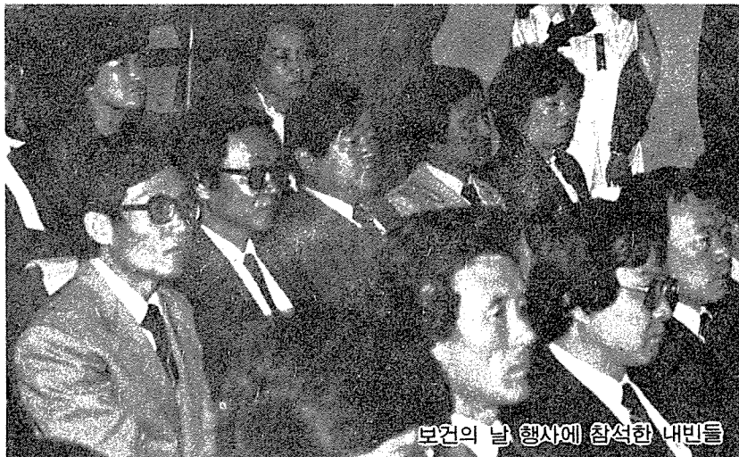
보건의 날 행사에 참석한 내빈들

정부는 4월 보건의 달 및 4월 7일의 보건의 날을 맞아 오전 10시 세종문화회관 강당에서 기념식을 가졌다.