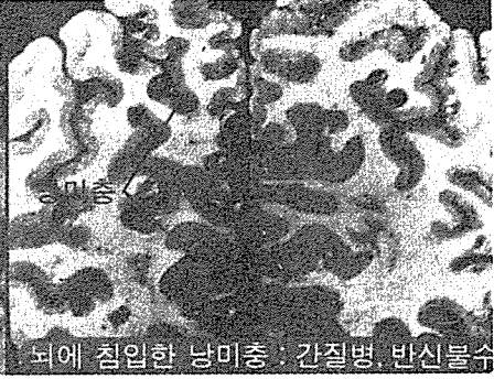
뇌에 침입한 낭미충 : 간질병, 반신불수