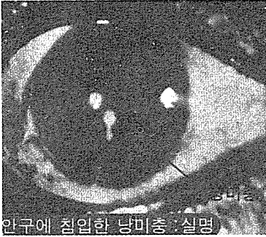
안구에 침입한 낭미충 : 실명