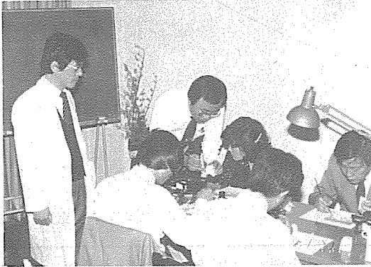
(사진은 연수회 풍경)

평가회에서는 앞으로의 보수교육을 이론적인 강의보다 임상에 필요한 실제적인 실기교육을 시켜줄 것을 원했다.