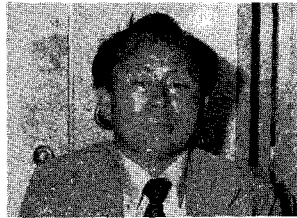
(이 구성 부장)