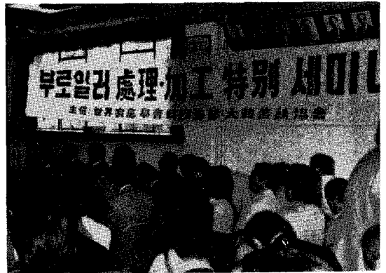
△사육농가, 도계장, 정부 등 관심이 집중된 부로일러 처리 가공 이용 세미나.