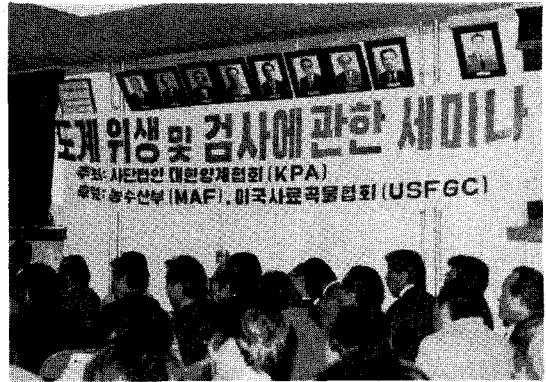
△ 닭고기 품질향상의 관심도가 높아 많은 참석자가 운집한 안양 세미나 (가축위생연구소)

본회는 86, 88의 국제적 행사를 앞두고 닭고기의 질적 향상이 시급히 요청되고 있는 가운데 닭고기의 품질향상으로 국제경쟁력을 높이고 소비를 확대시키기 위한 방안의 하나로 도계위생 처리 및 검사에 관한 세미나를 대구와 안양에서 각각 개최하였다.