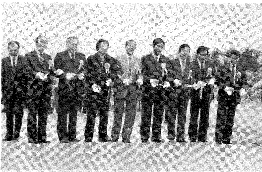
△ 준공기념 테이프 절단

본회 닭경제능력검정소 준공식이 지난 11월 15일(목) 경기도 안성군 서운면 중리 검정소 신축현장에서 농수산부 관계관, 본회임원, 유관기관 관계자, 지역주민 대표 등 80여명이 참석한 가운데 성대히 개최되었다.