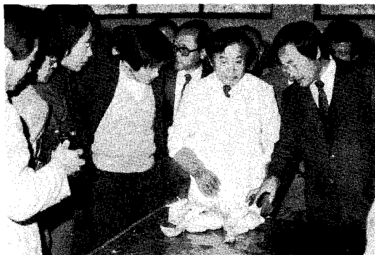
△도계장에서 미국의 도계처리 방법에 대한 실습이 진행되고 있다.

가 노력하고 있는데, 닭고기의 경우 지금과 같은 상태에서 수입이 된다면 살아남을 사람이 거의 없을 것이기 때문에, 서둘러 품질을 높임으로써 큰 타격을 줄이는 완충제 역할을 할 수 있도록 하기 위해 이번 세미나를 개최하게 되었다»고 밝혔다.