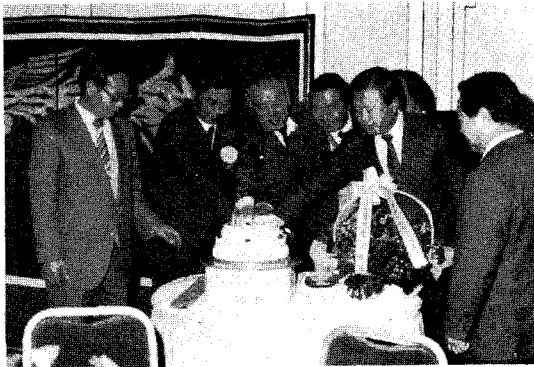
△ 본지 창간 15주년 기념회 케이크커팅

제정책개발 등 참신한 지식전달의 매개체로 업계를 선도하고 봉사해 왔다」고 밝히고 월간양계의 번영이 곧 양계관련인의 번영과 지위향상에 직결되는 만큼 더욱 발전하기를 기원하였다.