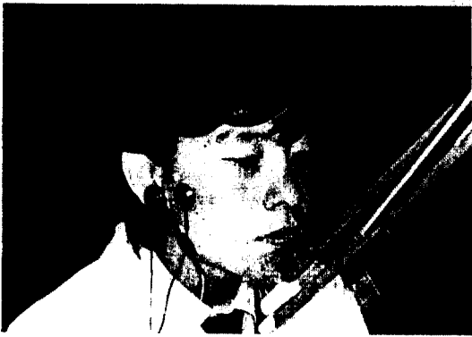
Photo. 3. Spring-driven tapping advice with plastic ruler and orthodontic chin cap.