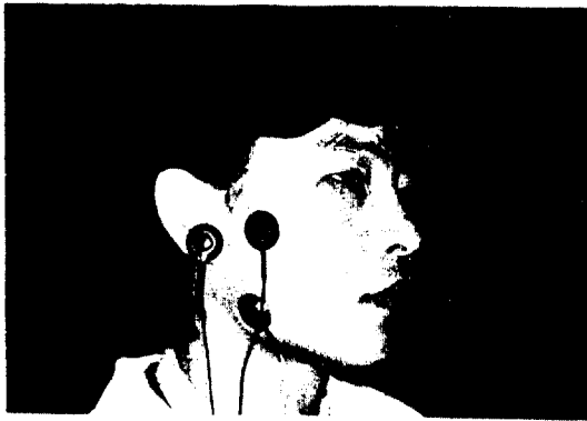
Photo. 4. Surface electrodes attached to the skin of insertion and origin of masseter muscle, and to the earlobe for ground