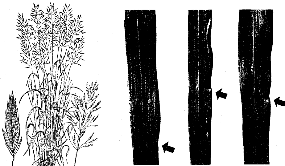
그림 1. 슴스 부로움그라스 (스웨덴 것처럼 생긴 모양)

초장은 티머시 목초와 비슷하나 뿌리는 섬유모양을 보여주며 잎사귀에는 V자 모양으로 깨맨 것과 같은 자국을 보여주는 것이 특징이라고 할 수 있으며 다른 목초와는 달리 잎짚이 원통으로 붙어 있는 것이 특징이다.